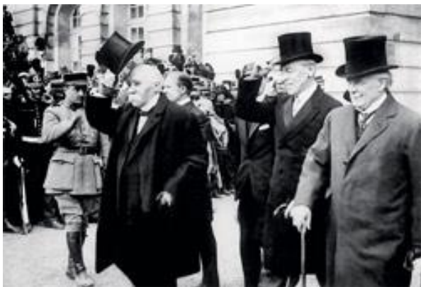
№ 1 № 2 № 3